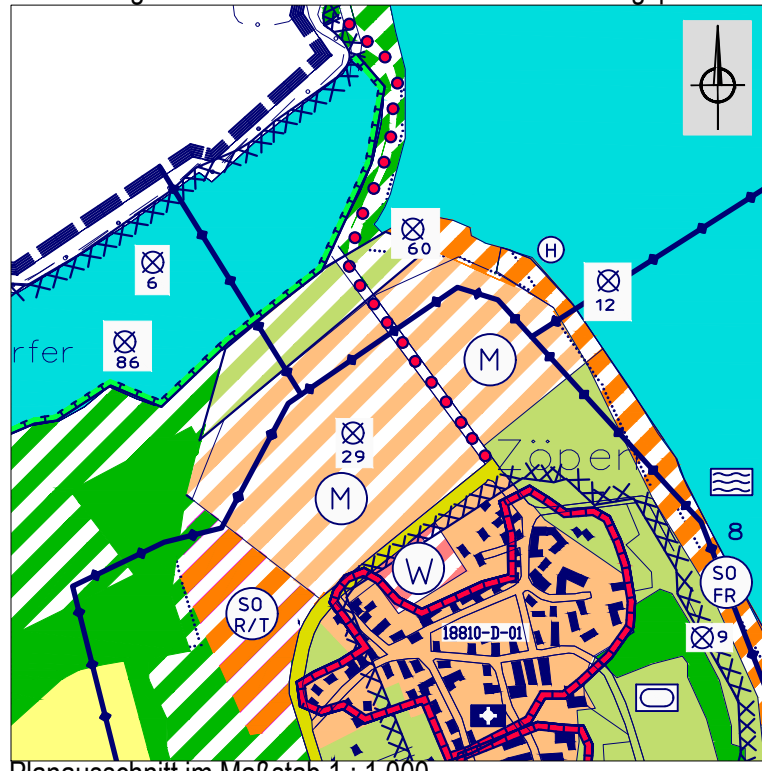
Planausschnitt im Maßstab 1 : 1.000

Planauszug aus dem rechtswirksamen Flächennutzungsplan