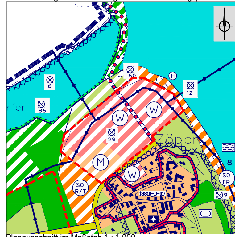
Planausschnitt im Maßstab 1 : 1.000

Planzeichnung zur 2. Änderung des Flächennutzungsplanes